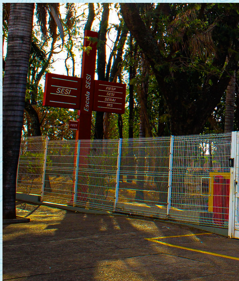
Sesi Araraquara 7 minutos