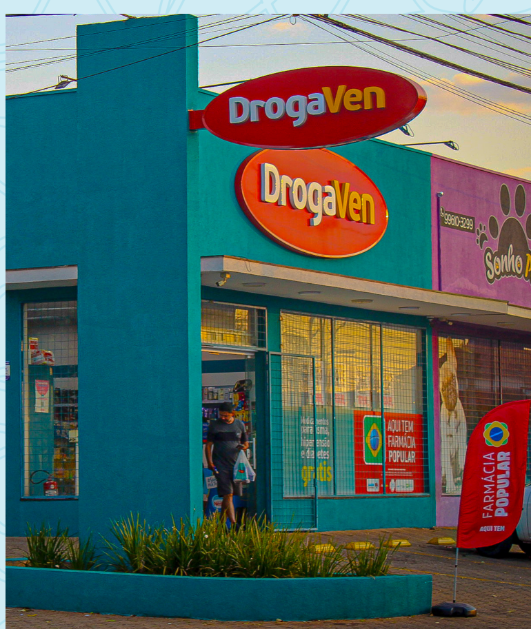
Farmácia DrogaVen 4 minutos