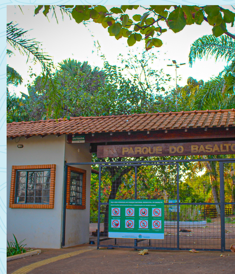
Parque Natural Municipal do Basalto 1 minuto