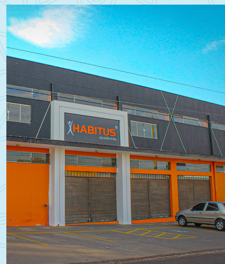
Academia Habitus 4 minutos