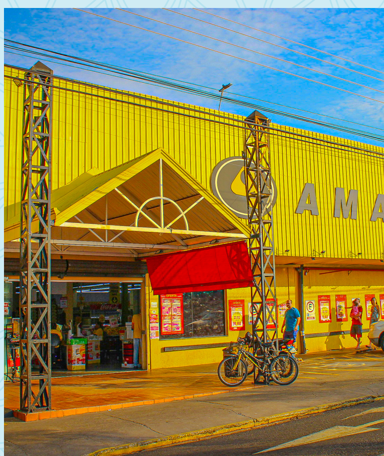
Amarelinha Supermercados - Loja 19 Vaz Filho 4 minutos