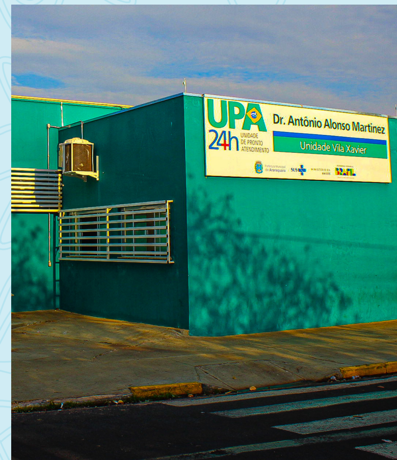
UPA Vila Xavier "Doutor Antônio Alonso Martinez" 8 minutos