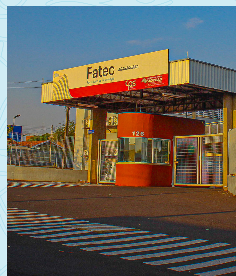
Fatec Araraquara 3 minutos