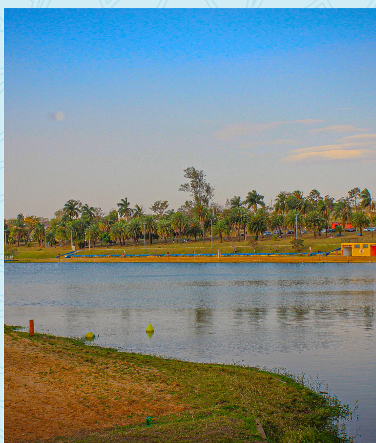
Parque Pinheirinho 5 minutos