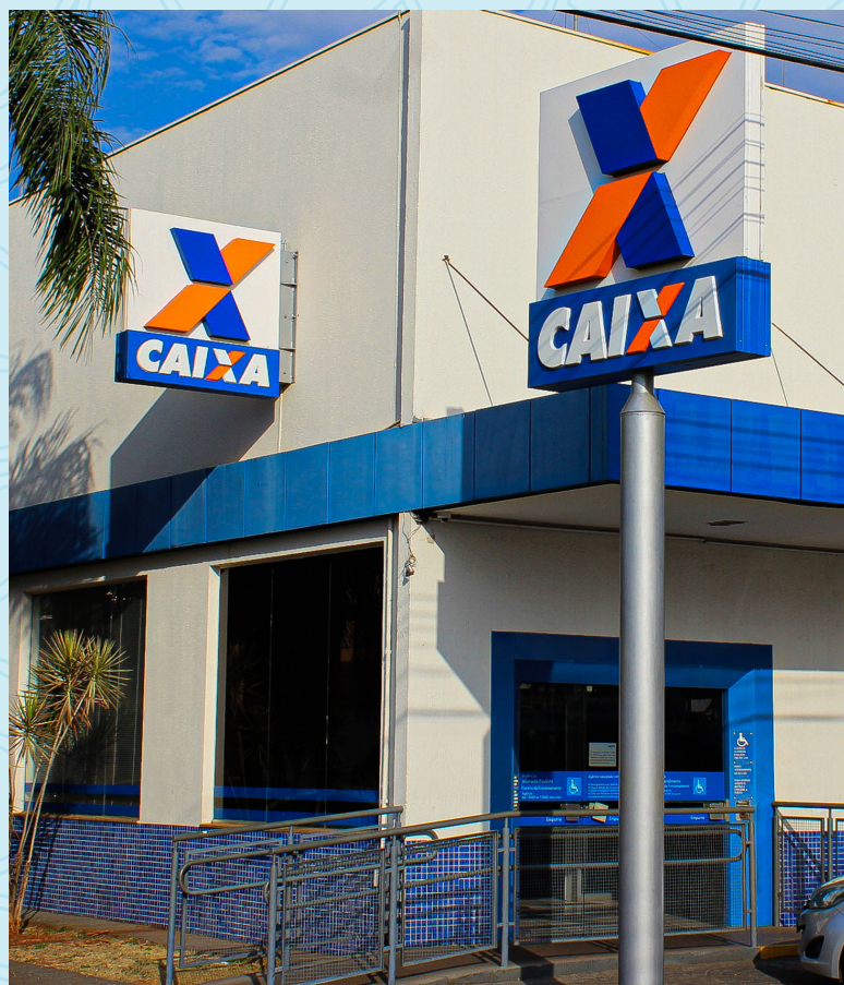
Caixa Econômica Federal 8 minutos