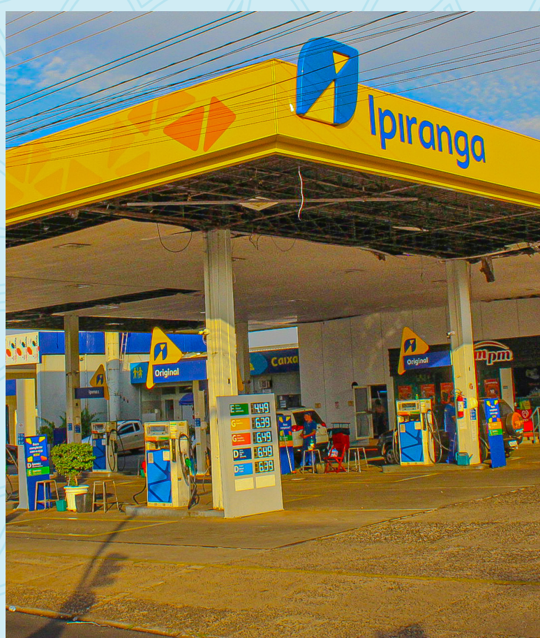
Auto Posto Vaz Filho (Posto Ipiranga) 4 minutos